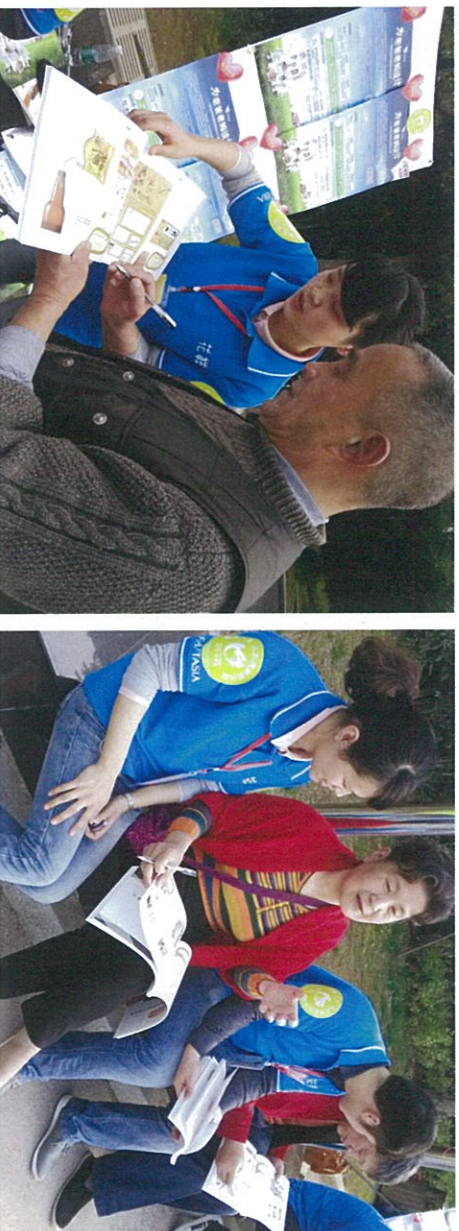
图：志愿者给老人们讲解公益大赛的参赛作品

3月23日,阳春三月的黄山桃红柳绿、草长莺飞,位于屯溪区新安山庄热闹非凡,由深圳市花样年公益基金会、安康年社区养老服务机构携手福泰年公司组织的“携手福泰年 亲情别样红”老人旅游专列来到黄山,在游览祖国大好河山享受乐龄生活的同时,给“发现幸福之旅——为爸妈老妈设计”适老空间及用品创意设计公益大赛入围作品投票,选出老人们认为最适合他们的适老设计作品。