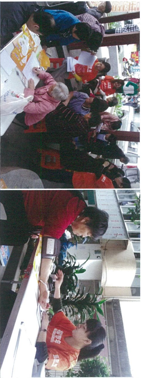
图：中医师、理疗师及志愿者团队为社区老人进行健康检查